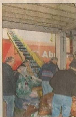
Les bénévoles en action.

Premier chargement de l'année, mardi, pour les "Bouchons d'Amour". Le camion de 90 m 3 (le 35 e depuis les débuts de l'antenne savoyarde) devrait représenter quelque 12 tonnes de bouchons. Collectés ces trois derniers mois sur l'ensemble du département dans les mairies, écoles et associations, les bénévoles les ont triés deux jours par semaine (retrait des bouchons non-conformes) avant de les stocker.